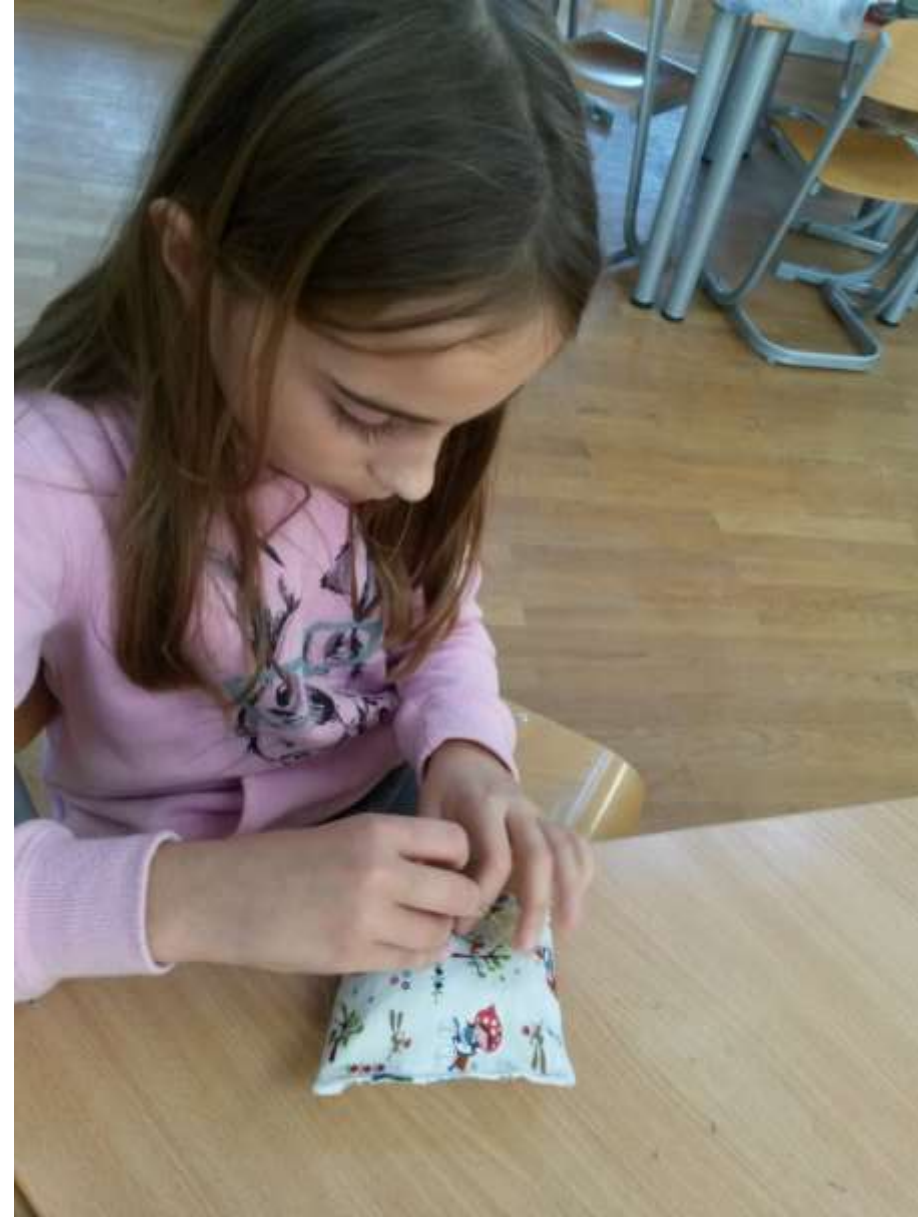
Šivamo ručno sve i svašta