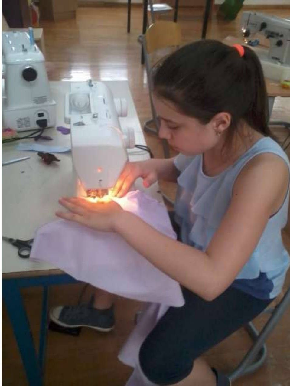
Šivamo torbe za kupovinu, pernice...