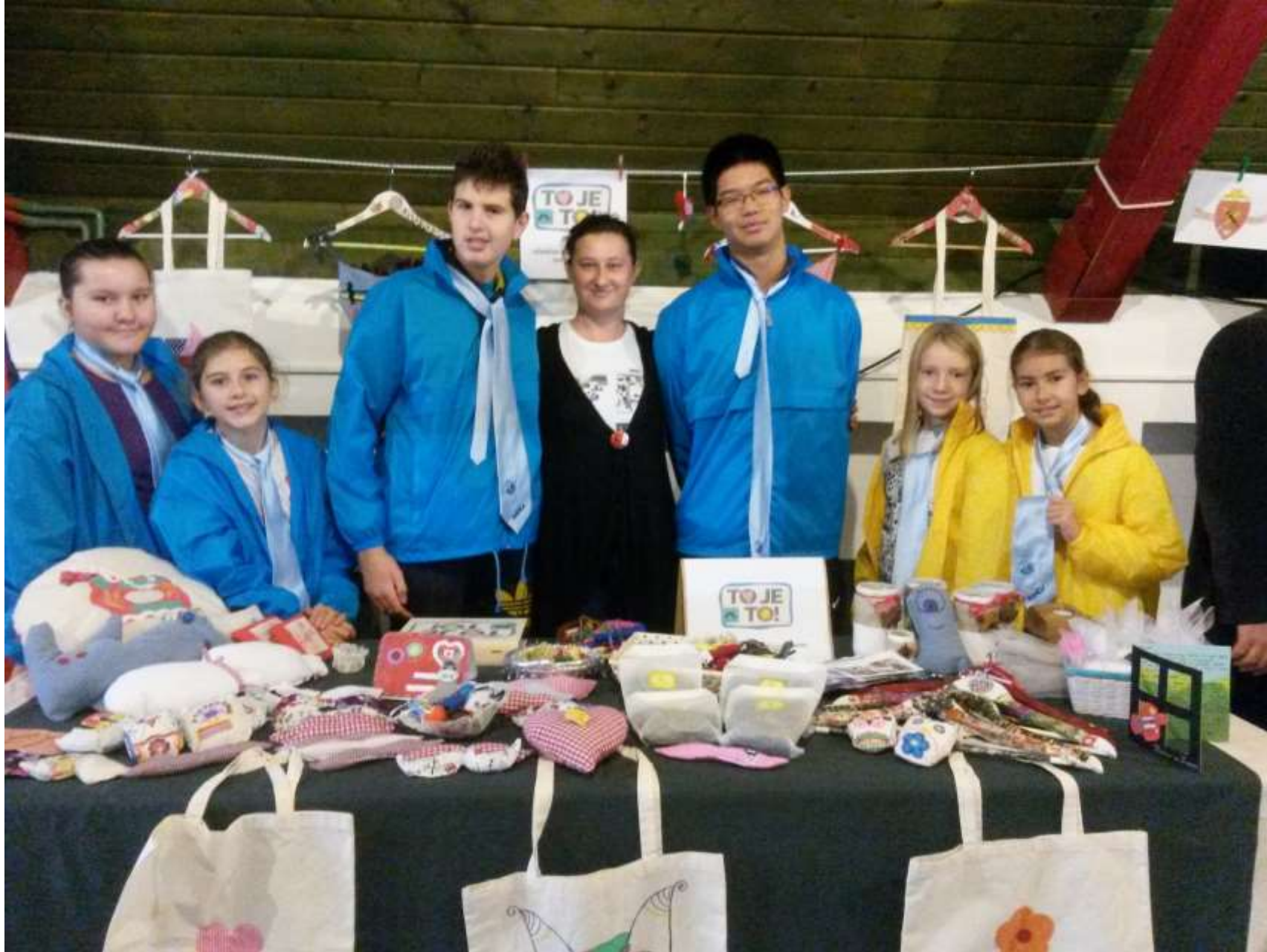
Manifestacija "Jesen na Knežiji", Dom kulture Knežiji i park na Knežiji, 10.10.2015.