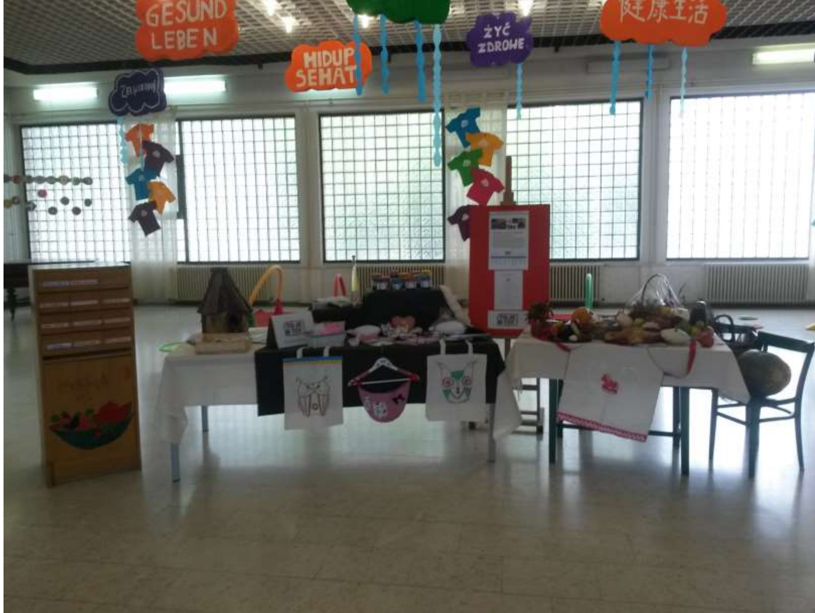
Dani kruha, seminar u organizaciji AZOO-a na temu održivog razvoja (Dobra ekonomija i učeničke zadruge) - izložba i prodajni sajam, 16.10. 2015.