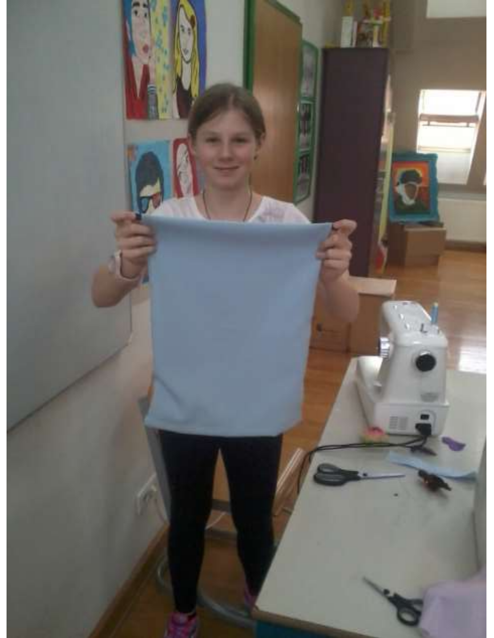
Šivamo i torbe za školsku obuću!