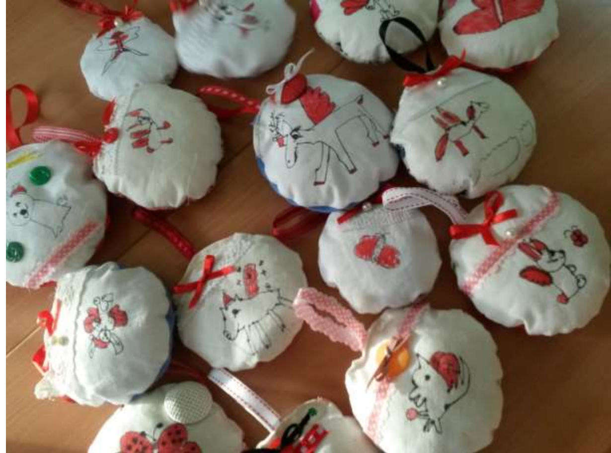
Suradnja s OŠ Savski Gaj povodom Božićne radionice i Božićnog sajma (šivanje ukrasnih jastučića za Božićnu jelku), 15.12. 2015.