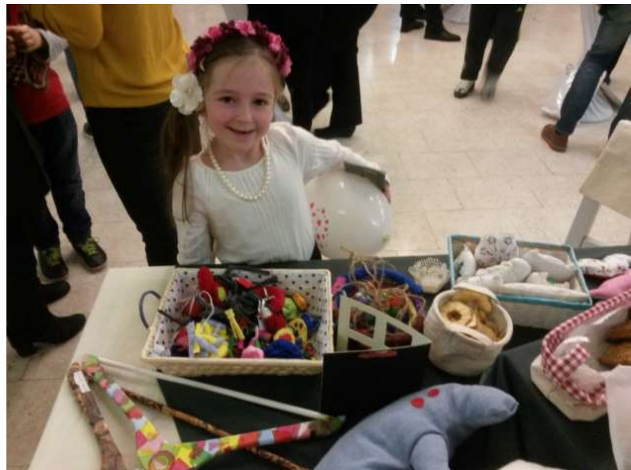
Naši najvjerniji kupci