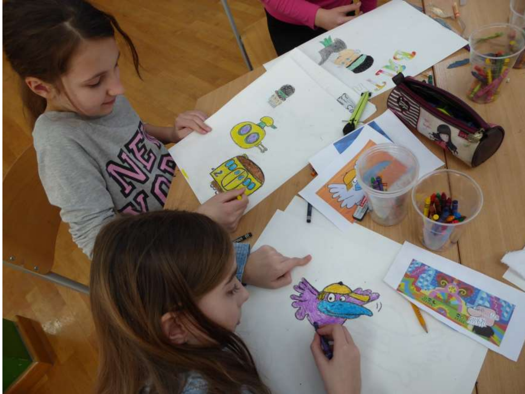
Istražujemo Zagrebačku školu crtanog filma i crtamo najdraže nam likove iz crtića Zagrebačke škole