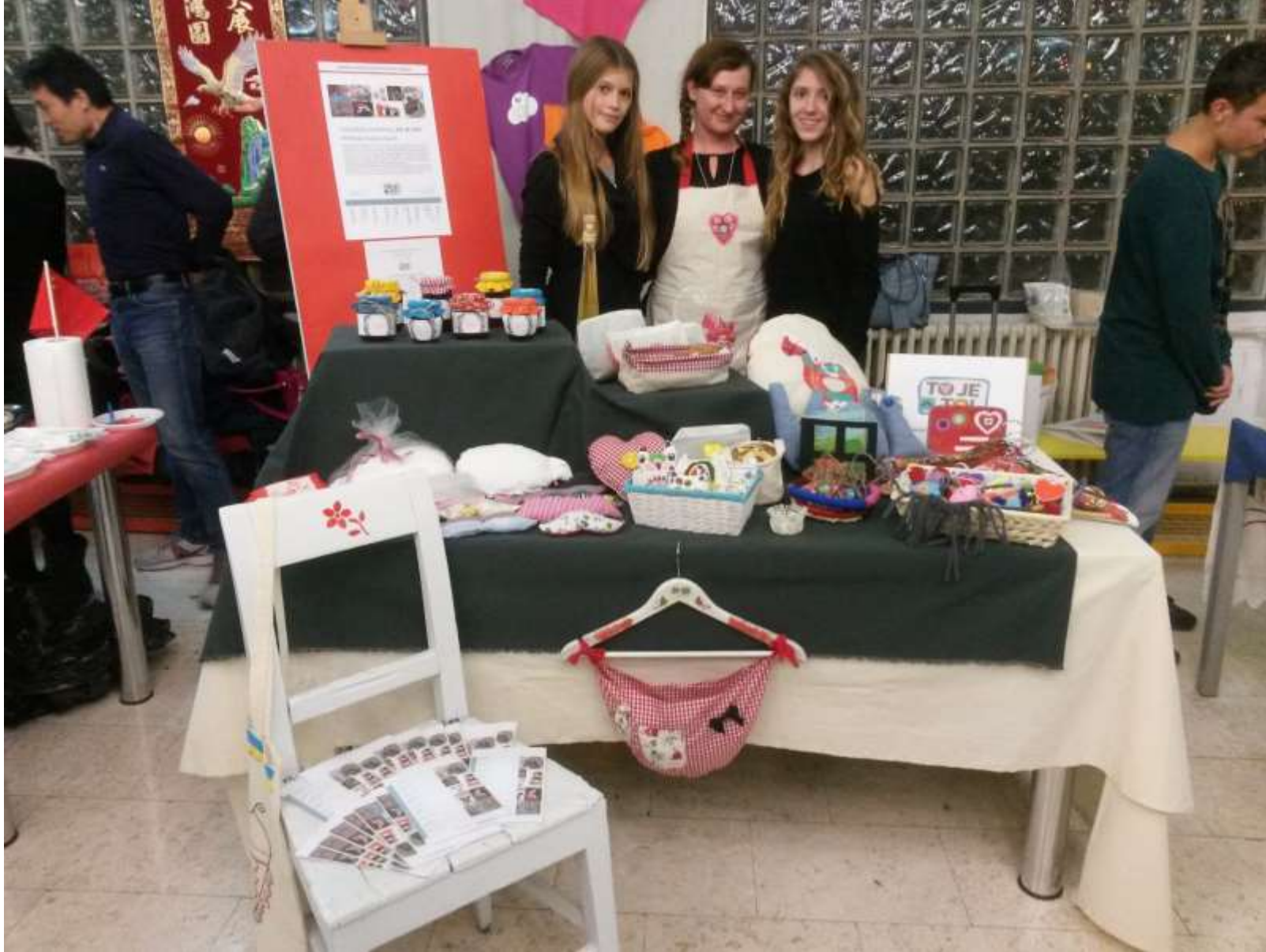
Dan međunarodne zajednice (International Community Day), prodajni i izložbeni sajam u našoj školi, 23.10. 2015.