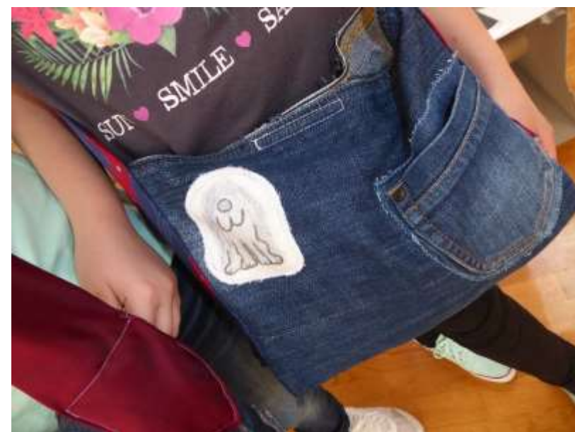
Torbe iz kolekcije "Zagrebački crtić hitić"