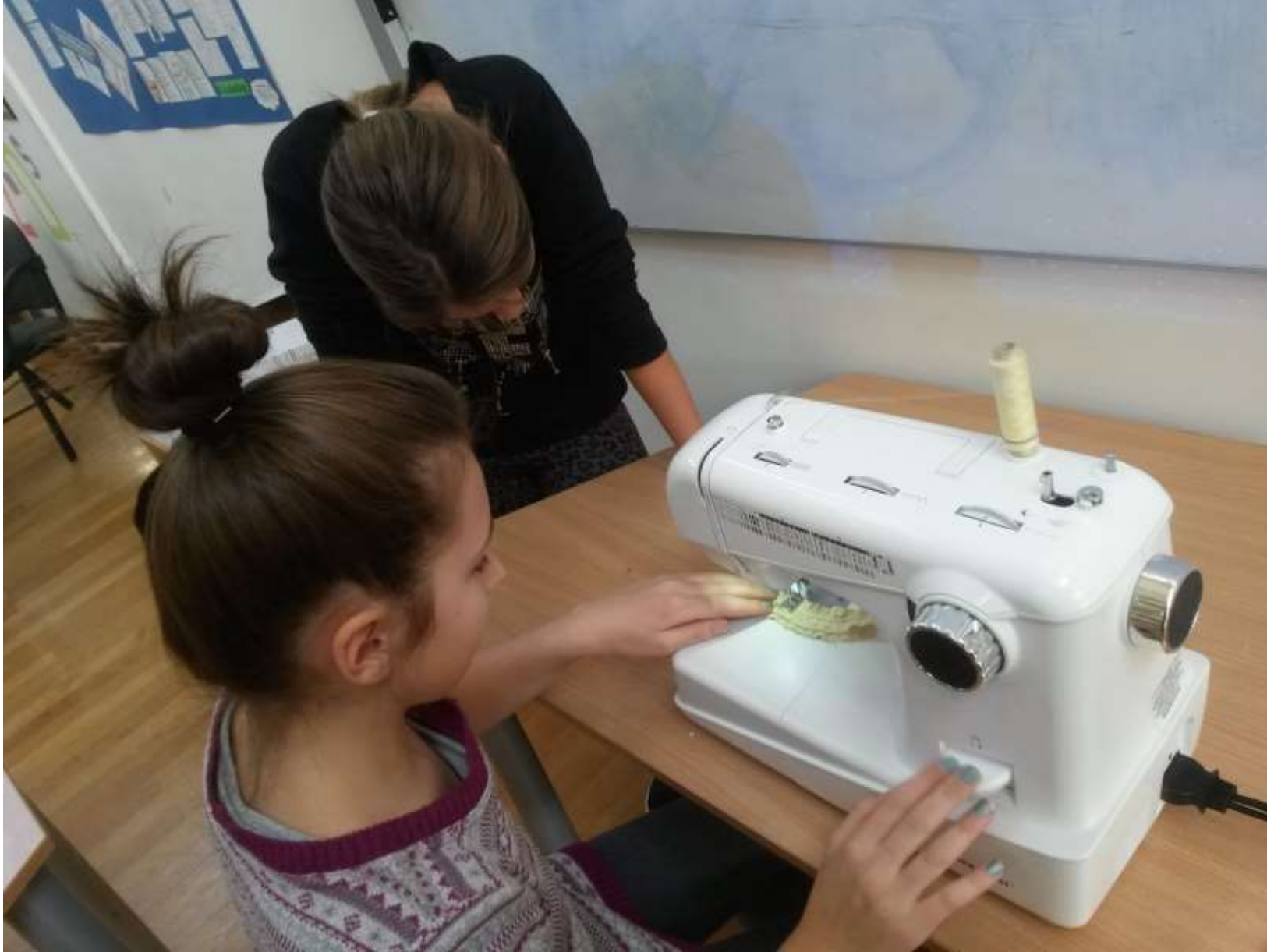
Učimo jedni od drugih