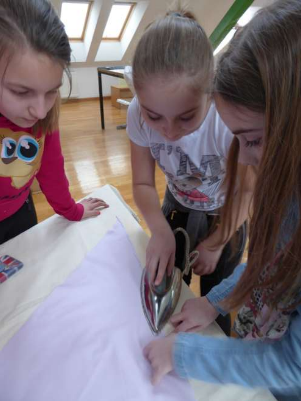
Naučili smo i dobro peglati.