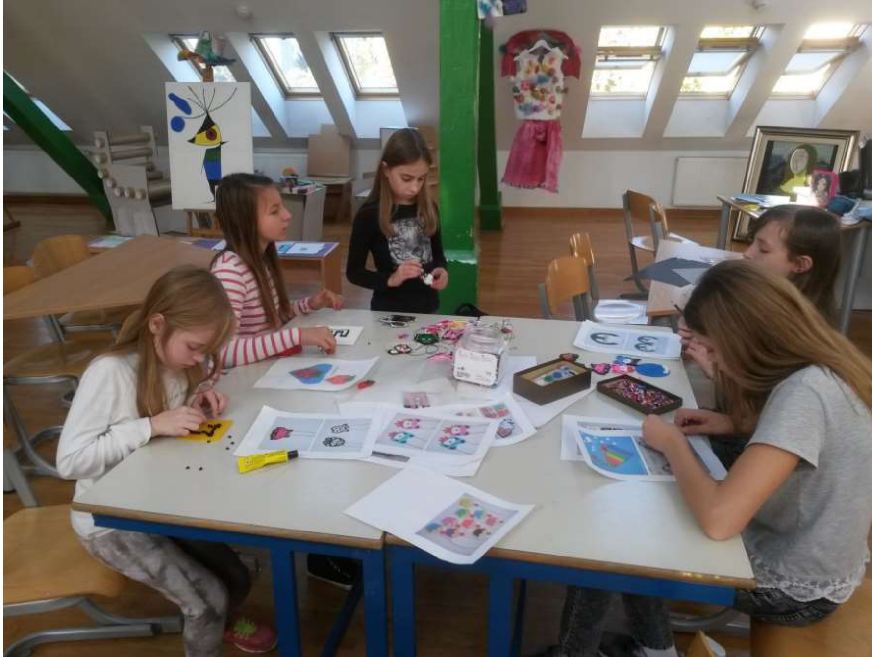
Izrada pixel art nakita od plastičnih perli