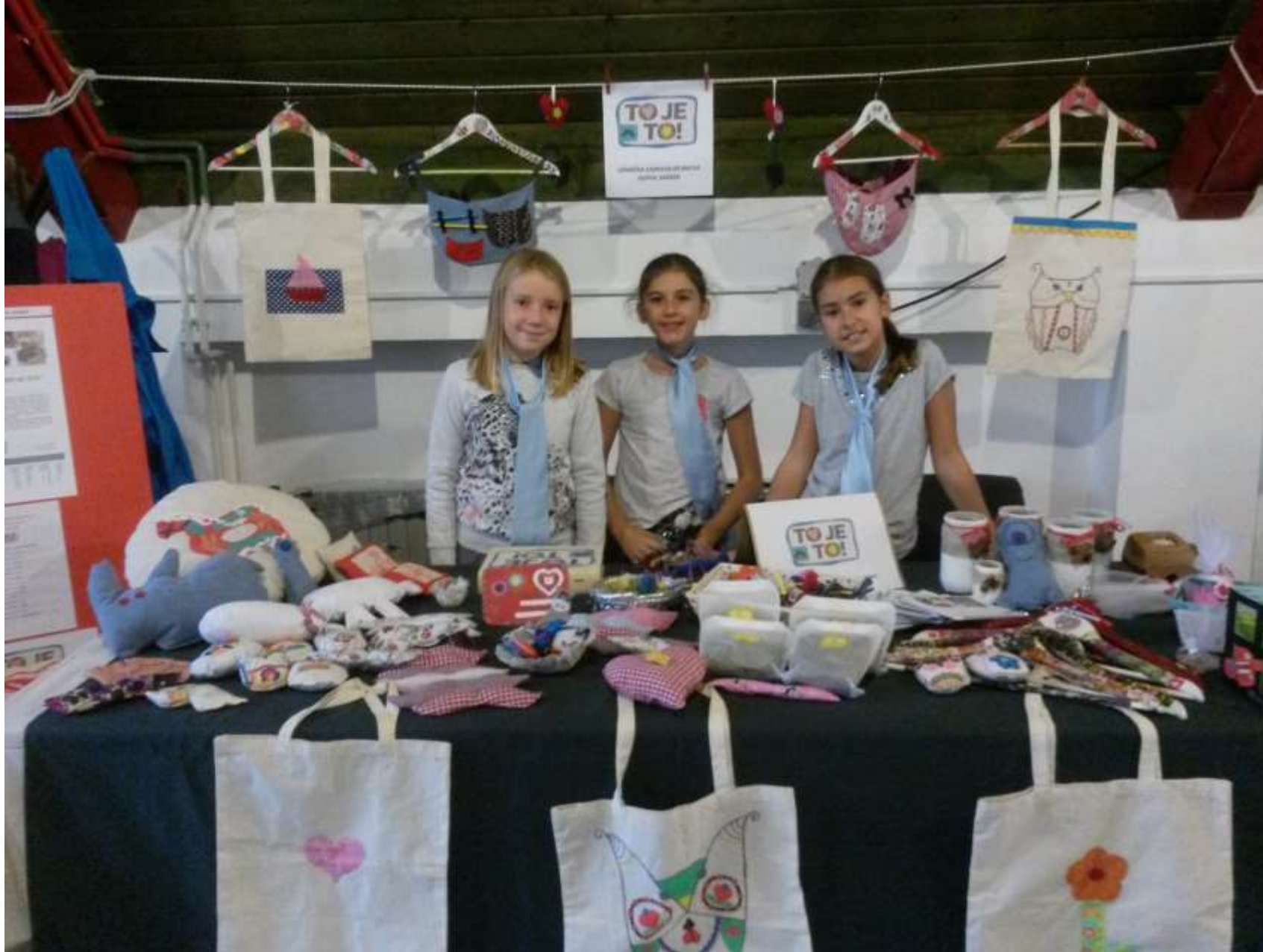
Naši zadrugarski proizvodi