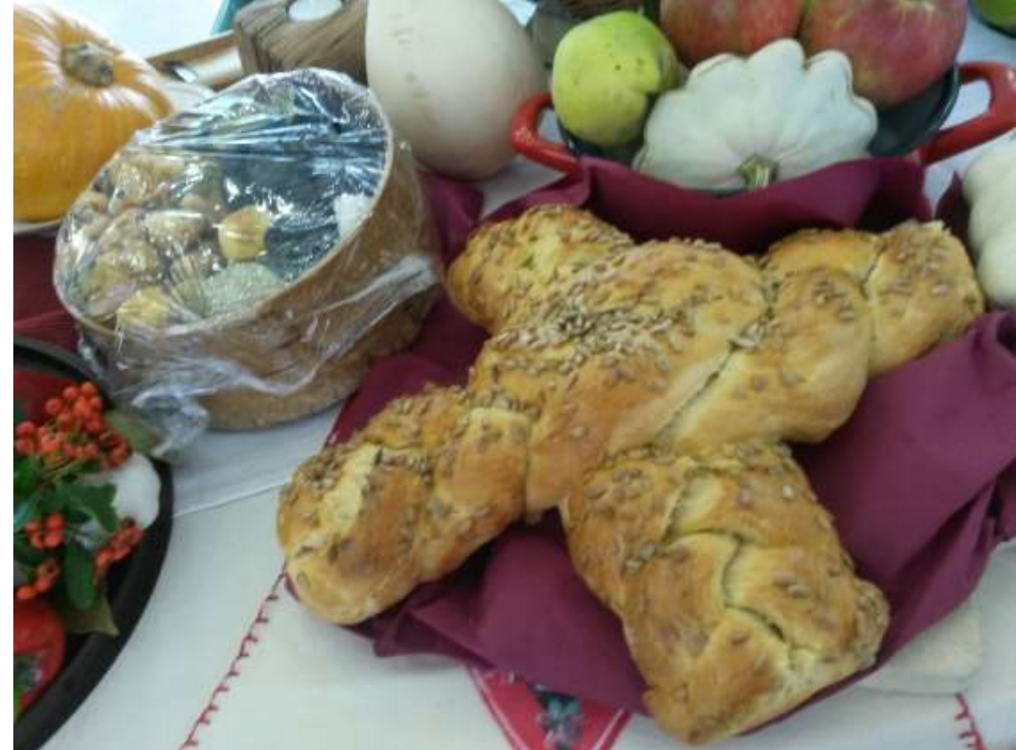
Dani kruha i plodova zemlje, 16.10. 2015.