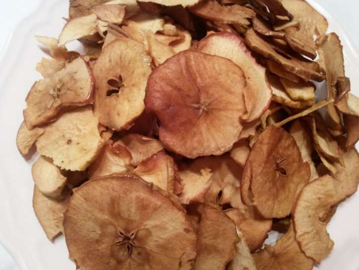
Dan jabuka, 20.10. 2015. - domaći čips od jabuka i zobeni keksi s jabukama, zadrugarski eko proizvod